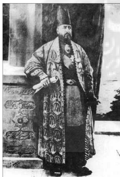
میرزا محمدتقی خان فراهانی (امیرکبیر) (۱۱۸۶-۱۲۳۰ ش)