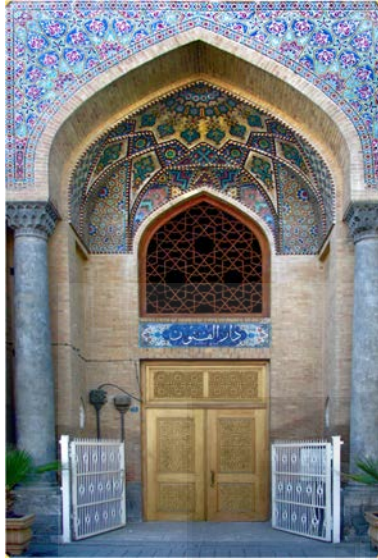
دروازه ورودی مدرسه دارالفنون

نوشتن از چپ به راست رقم‌های عددی را داخل متن‌های نوشته شده از راست به چپ پذیرفته و کاتبان هم به آن خو گرفته بودند.