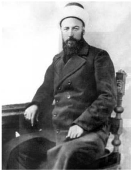
میرزا حسن رشديه (۱۲۳۰-۱۳۲۳ش)

از دیدگاهی همه‌سویه، روش آموزشی مکتب‌دارها شیوه‌ای آرمانی نبوده و آنان هم زندگی چندان بهنجار را نداشته‌اند و فرهنگ‌دوستانی در راستای دستیابی به شیوه آموزشی بارورتر در تکاپو بوده‌اند. شیوه‌ای که مکتب‌دار (=معلم) نیز آن را باور داشته باشد و به کار بندد.