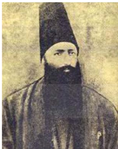
میرزا ابوالقاسم فراهانی (قائم مقام) (۱۱۵۸-۱۲۱۴ ش)