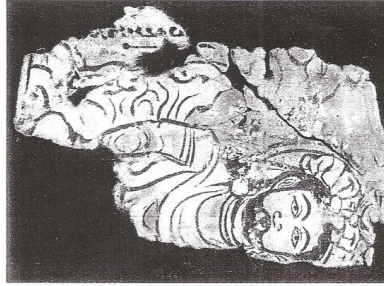
Fig. 50.2 (MIK III 4970 c recto[?] and verso[?])