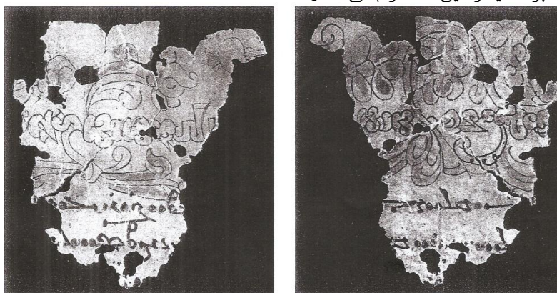
Fig. 50.1 (MIK III 4970 b recto[?] and verso[?])

آشکار است که این چهره فردی از جامعه مانویان نیست؛ زیرا هیچ کدام از لباس‌های ویژه آنان را نپوشیده است. او ممکن است خدایی یا چهره‌ای تاریخی مثلاً پادشاهی باشد که روزگاری از مانویان پشتیبانی کرده است یا ممکن است پیامبری باشد؛ زیرا در کیش مانوی به پیامبران دیگر دین‌ها احترام می‌گذارند (Gulacsi, 2001: 117-118).