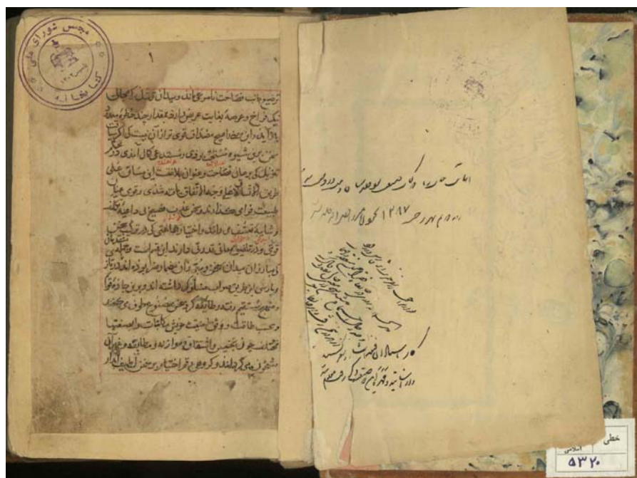
تصویر صفحه نخست نسخه ۵۳۲۰ کتابخانه مجلس