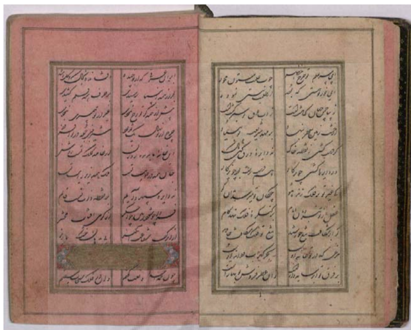
تصویر ۲: تصویر صفحات داخلی و رنگ زمینه

جزوبندی چهاربرگی (جفتی) است و در چیدمان آن از یک جنس کاغذ با دو رنگ روشن و قرمز استفاده کرده‌اند. کاغذها به صورت یکی در میان (یک کاغذ با زمینه روشن و یک کاغذ با زمینه قرمز) گذاشته شده‌اند. این ترتیب در همجواری جزوها رعایت شده است، تنها در همجواری جزو سوم و چهارم خطایی رخ داده است. مجموعه ابیات در سیزده جزو کتابت شده و جزو سیزدهم به عمد کاتب، سه‌برگی است (تصویر ۲).