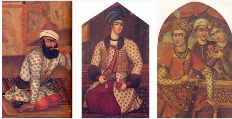
تصویر ۵: تصاویری از دوره زندیه (مرجع: مکداول ۱۳۷۴)

این نسخه در سال ۱۳۸۱ش به کتابخانه آیت‌الله مرعشی اهدا شده است، اما هیچ آگاهی‌ای از وضع پیشین آن در دست نیست. نسخه شرایط خوبی دارد که نشانگر وضعیت نگهداری مناسب است. این احتمال وجود دارد که در یک مجموعه عمومی قرار داشته است. بر آغاز و پایان نسخه، مهر مدور «مراجعه و تفتیش» دوره پهلوی اول، جمله «ملاحظه شد» و مهر ثبت زمان (۱۳۱۲ش) خورده است؛ بنابراین این در ۱۳۱۲ش در مجموعه‌ای عمومی یا خصوصی بازبینی دولتی شده است (تصویر ۶). برخی صفحات نیز مهر کتابخانه آیت‌الله مرعشی را بر خود دارند که مربوط به دوره پس از اهدای آن است.