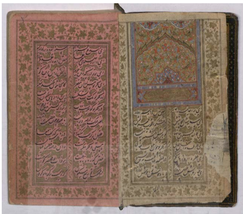
تصویر ۳: تذهیب صفحات اول و دوم