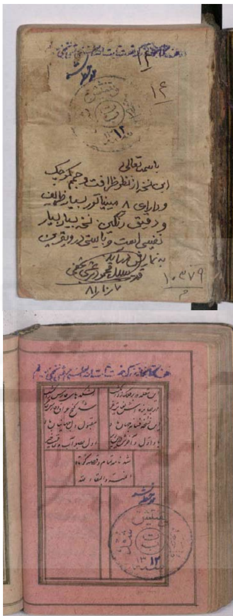
تصویر ۶: تصاویر صفحه اول و آخر