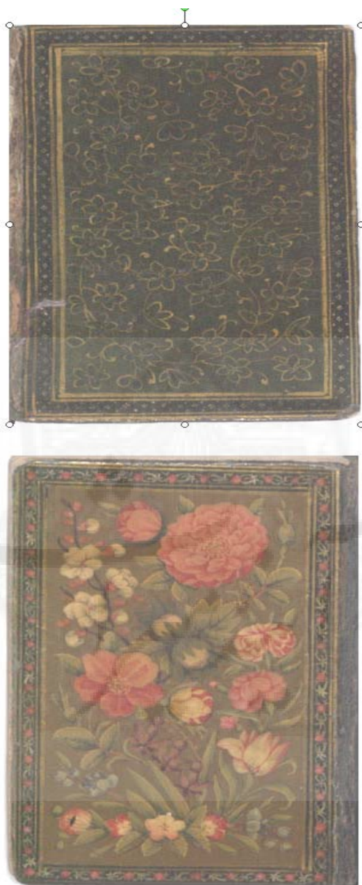
تصویر ۱: رویه جلد کتاب و صفحه داخلی