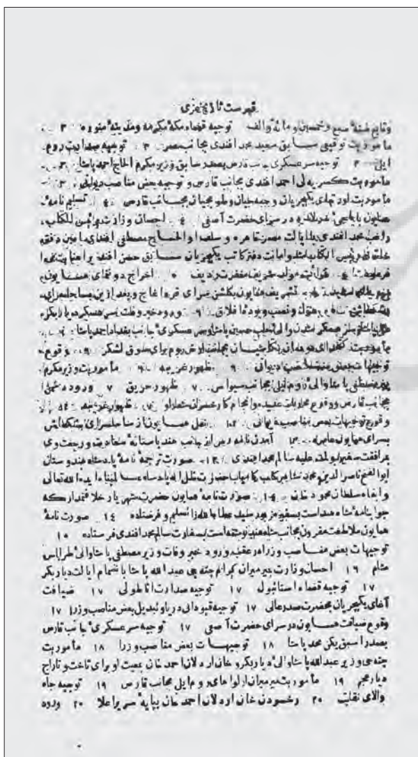
تاریخ عزی چاپ استانبول