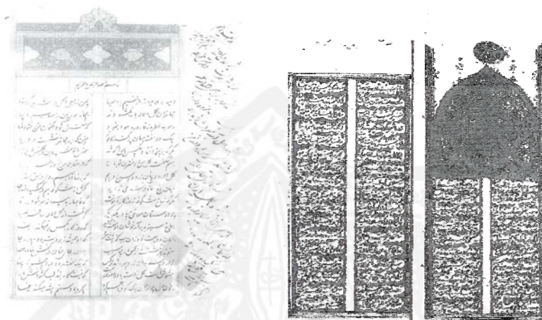
صفحه نخست نسخه ۲۴۰۱ کتابخانه ملی

نستعلیق خوش کتابت گردیده، هر فصل با مرکب قرمز و در بعضی صفحات ابیات به شکل حمایلی نوشته شده است.