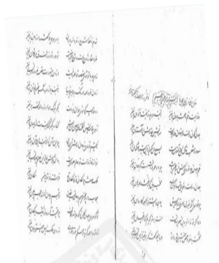
صفحة نخست نسخة ۱۱۸۳ کتابخانه مجلس